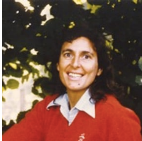
Katarina Taikon (1932-1995)

Böckerna är till stor del självbiografiska och skildrar hennes liv från sjuårsåldern till övre tonåren. Efter att modern dött tidigt hamnade Taikon i fosterhem i Skellefteå och 2015 förärades hon en gata i kommunen.